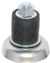
Espansori in gomma